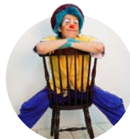
クウランムーラン